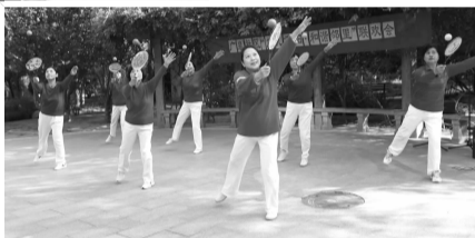
柔力球队参加社区重阳节联欢会