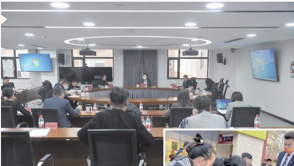
▲理论中心组学习区第十三次党代会精神