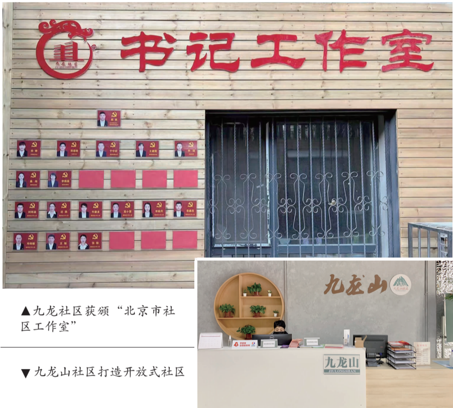
▲九龙社区获颁“北京市社区书记工作室”

造，全流程开展线上、线下规划设计、议事协商及定期维护清洁活动，引导居民从建、用、管全周期参与，最终形成以实用为基础的人文景点，推动形成国际化工作室示范教学点位。落细以文化引领实践的要求。举办“奋斗百年路，启航新征程”庆祝中国共产党成立100周年文艺汇演。开设剪纸艺术班、剪纸艺术展，吸引了众多中外人士参加，了解和传播传承中华优秀传统文化。升级改造科普体验厅，通过互动体验、VR体验、多媒体互动、科技探索等各项功能，引导居民将低碳、绿色、环保理念融入日常生活。组织乐成国际学校、艾尔思幼儿园的孩子进行科普体验活动。文化促进融合，文明引领实践，已成为九龙社区融入国际可持续发展社区建设的重要探索。