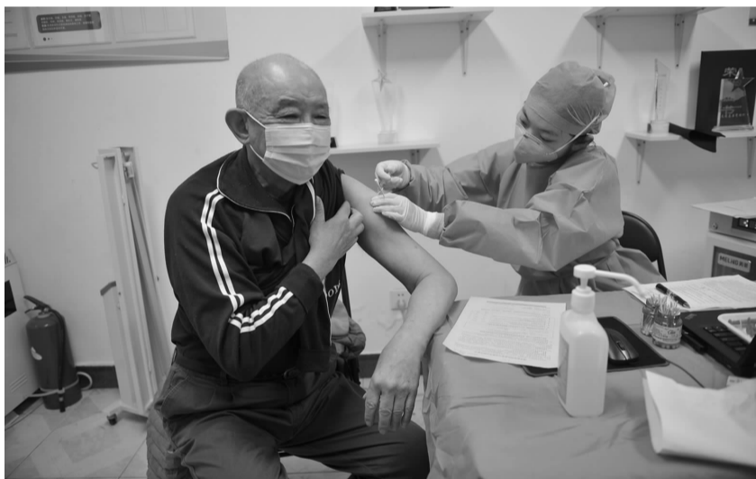
居民在临时接种点接种疫苗