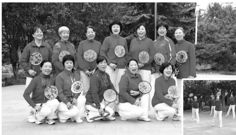
表演结束后合影留念