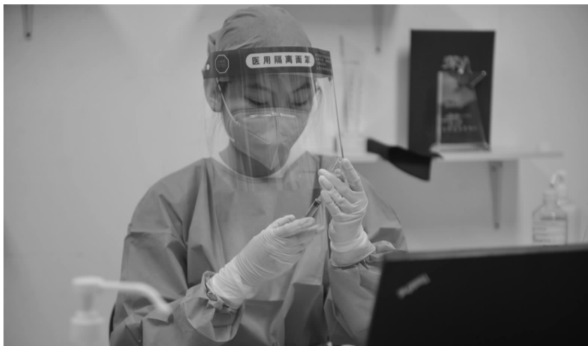
护士为疫苗接种做准备

疫情数据变化,对区域内的人员进行大数据流调。”街道工作人员说道。对于检查中出现的问题,已责令限期整改。与此同时,各社区加大对疫苗接种的宣传。除合生汇、和平村疫苗接种点以外,18个社区分别根据本社区情况,不定时设立临时疫苗接种点。